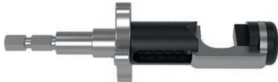
with quick-connector mit 6-Kant-Schnellkupplung