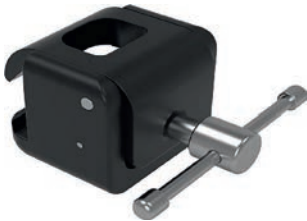
Table clamp, heavy duty Schwerlastschienenklemme