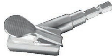
with quick-connector mit 6-Kant-Schnellkupplung