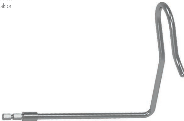
Liver retractor Leberretractor