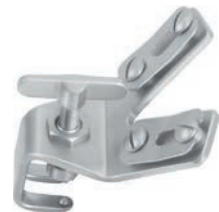
for 2 arms, for fixing to the rigid arm für 2 Arme, zum Festschrauben am Starrarm