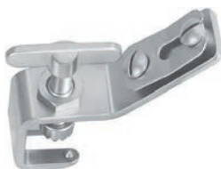
for 1 arm für 1 Arm