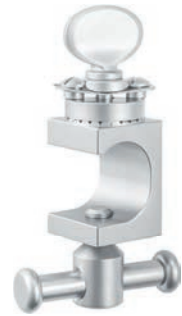
laterally open seitlich offen