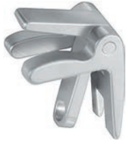
for flat spatulas für flache Spatel