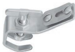
for 1 arm, for fixing to the rigid arm für 1 Arm, zum Festschrauben am Starrarm