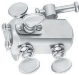
for max. 5 flexible arms für max. 5 Spannarme