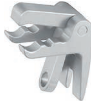
for spatulas with round stem für Spatel mit rundem Schaft