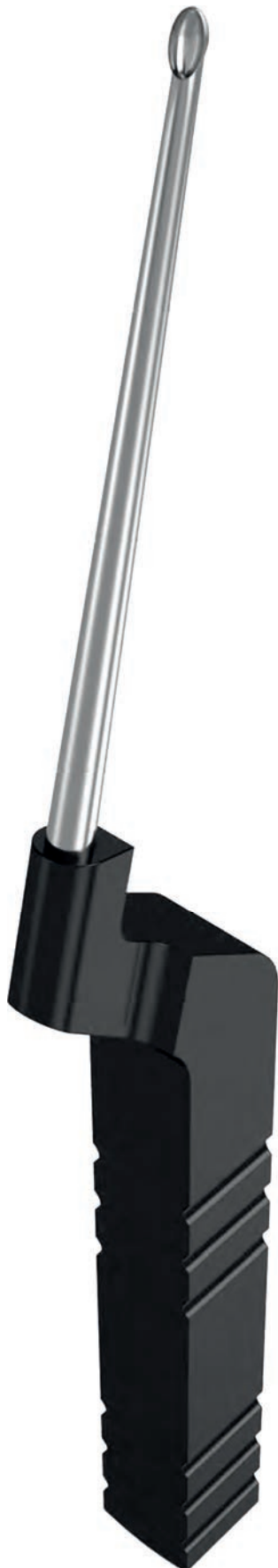
forward straight vorwärts gerade